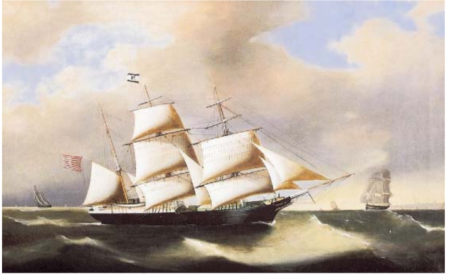
Um 1840 segelten zwölf Schiffe unter der weiß-blauen Melchers-Flagge, die hier am Topmast flattert.