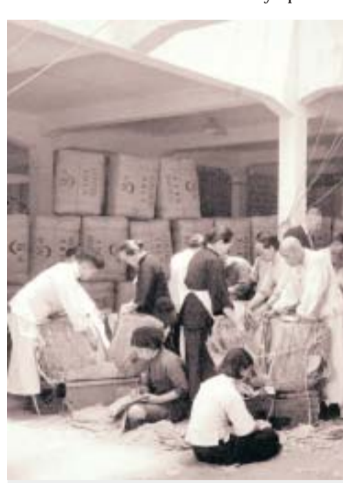
Um 1870: Sortieren von Tabak im Melchers-Lagerhaus in Shanghai.